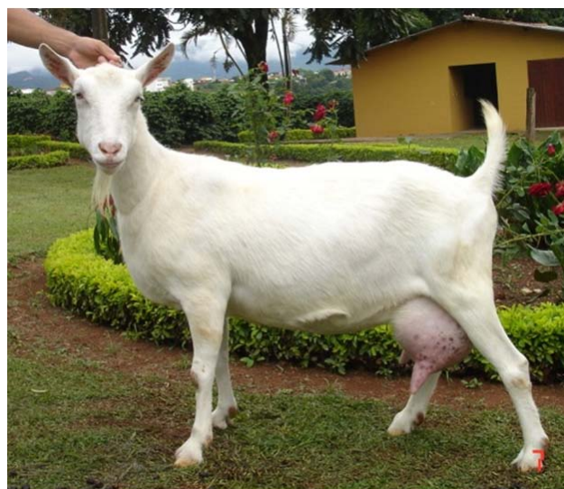
Pierina Capril Por do Sol – filha do OPÇÃO . Cabrita de 1ª. cria com média de 6,22kg no Controle Leiteiro Oficial.

Vale lembrar que não existe animal perfeito, mas temos sim a possibilidade de escolher a melhor opção para sua matriz, e essa escolha pode ser individualmente realizada se necessário – uma grande vantagem da inseminação. E como forma de facilitar a seleção dos melhores doadores para cada matriz de seu rebanho, criamos alguns ícones indicativos que indicam quais as características que cada reprodutor agrega – uma novidade do catálogo de 2010 Top in Life / CRV Lagoa. E por essas razões é que bode bom está no botijão, use e abuse da inseminação.